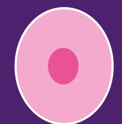
Cambio de forma