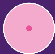
Retracción del pezón