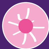
Crecimiento de venas